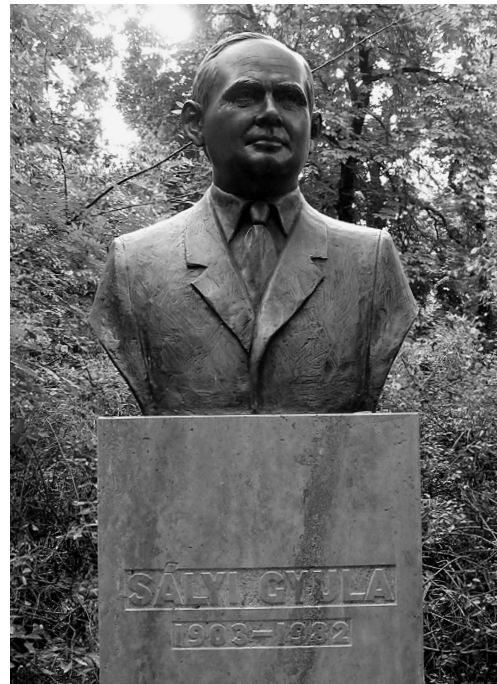
SÁLYI GYULA MELLSZOBRA AZ EGYETEM PARKJÁBAN (DOMONKOS BÉLA ALKOTÁSA)

25 állatorvos-évfolyamot nevelt fel. Kristálytisza logikával szerkesztett, gondosan előkészített, közérthető, tömör stílusban felépített előadásait, amelyek élményt nyújtottak hallgatóinak, visszafogott, bölcs humorral fűszerezte.